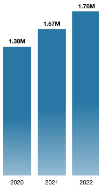
Figura 1: Selecciones de planes de Covered California para comenzar las coberturas en los años 2020, 2021 y 2022 1

Más de 6 millones de californianos han sido infectados por el virus y el total de muertes se ha acercado a 80,000 personas.